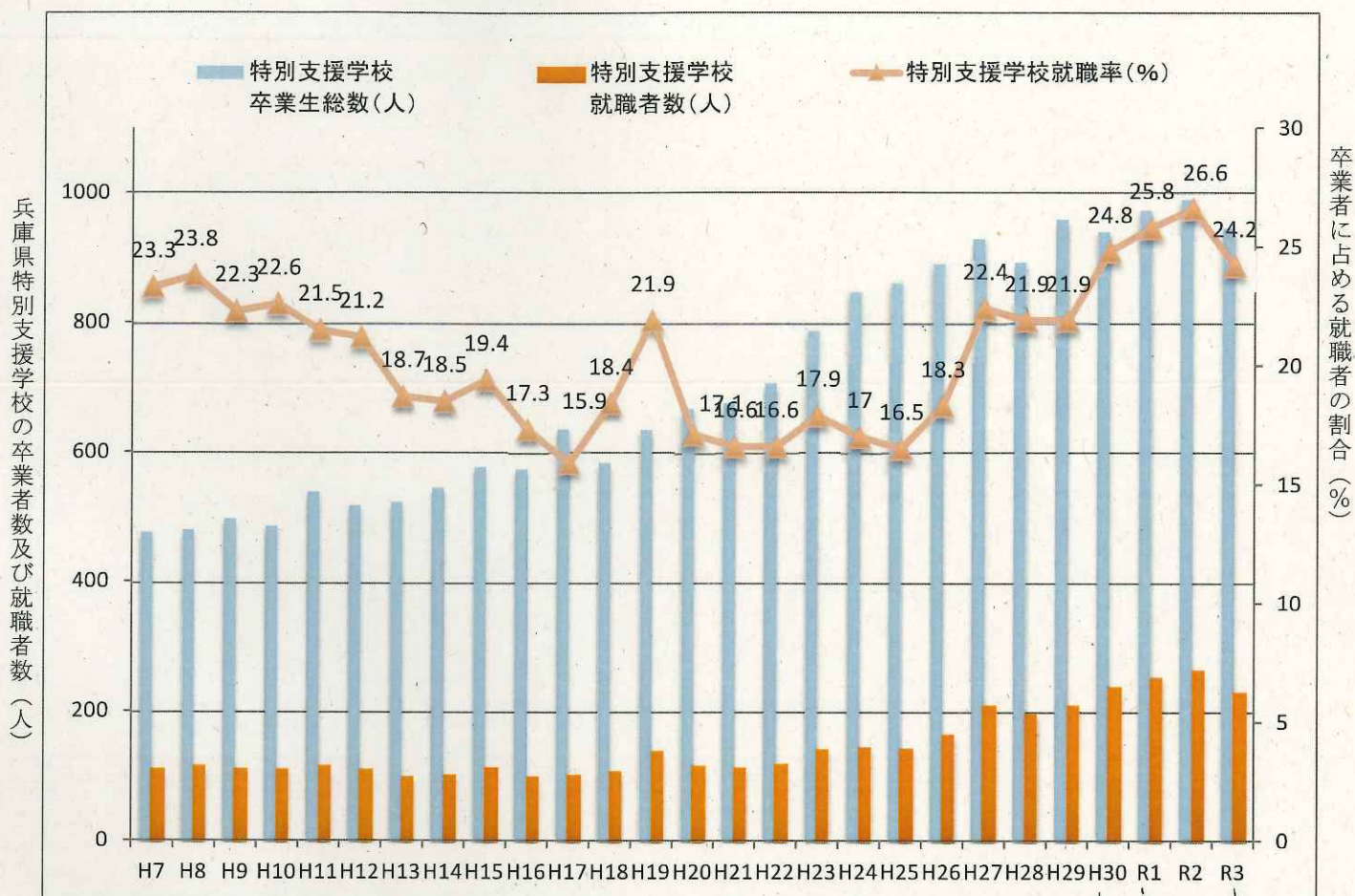
(参考) 兵庫県特別支援学校高等部卒業生の就職状況の推移〔学校基本調査〕