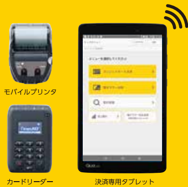
モバイルプリンタ