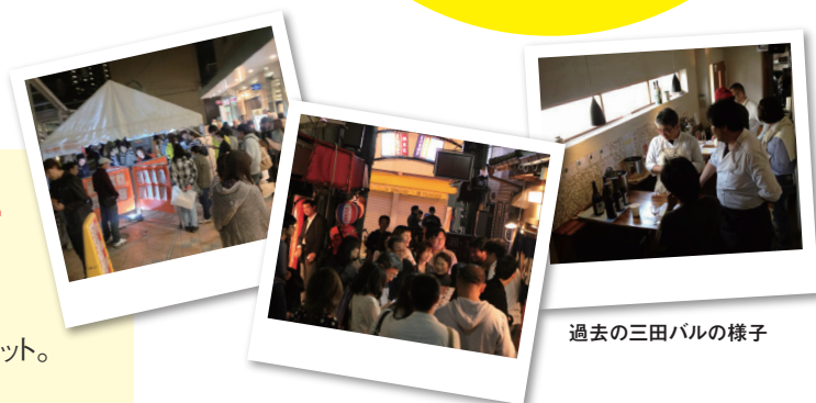
過去の三田バルの様子

バルの翌日からチケットの換金までの期間(10/14~10/23)に 未使用のチケットを使用できる参加店舗のみで、500円の 金券としてそのお店で使用できる。