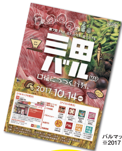
バルマップ ※2017年度版